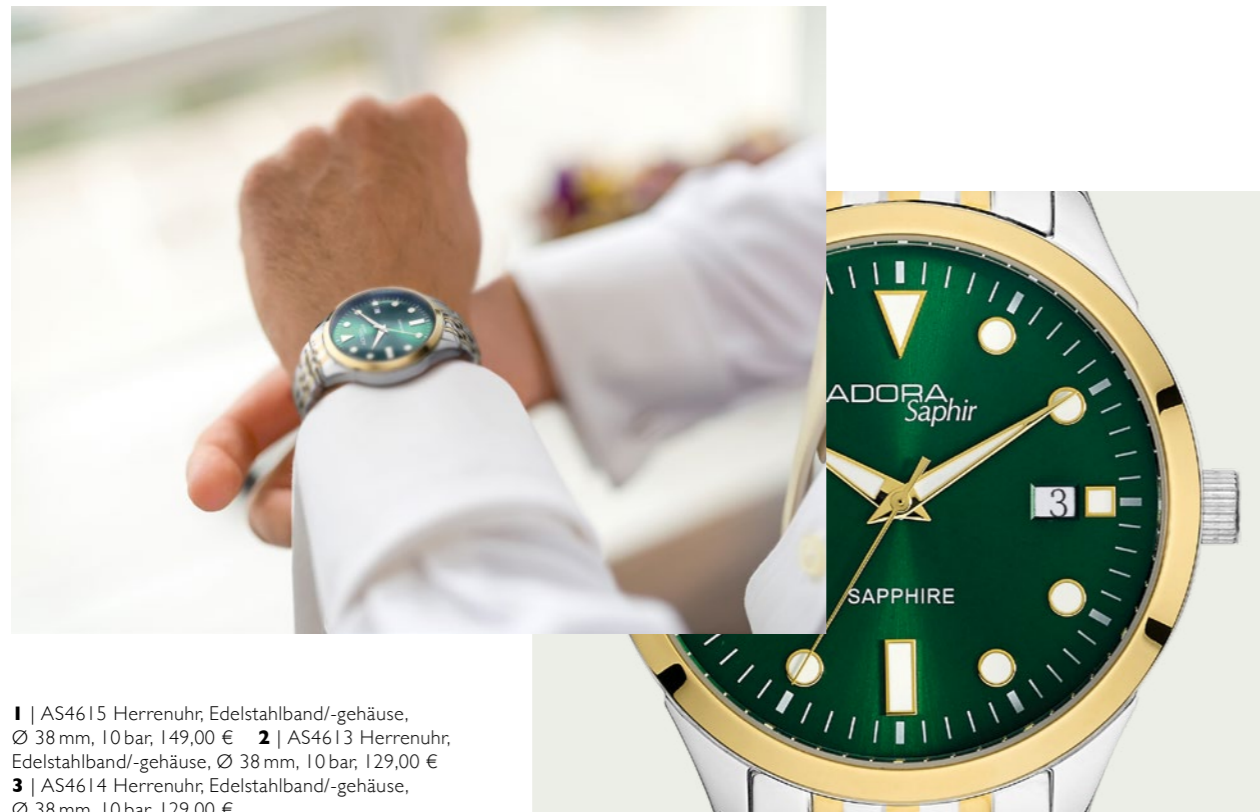
1 | AS4615 Herrenuhr, Edelstahlband/-gehäuse, Ø 38 mm, 10 bar, 149,00 € 2 | AS4613 Herrenuhr, Edelstahlband/-gehäuse, Ø 38 mm, 10 bar, 129,00 € 3 | AS4614 Herrenuhr, Edelstahlband/-gehäuse, Ø 38 mm, 10 bar, 129,00 €