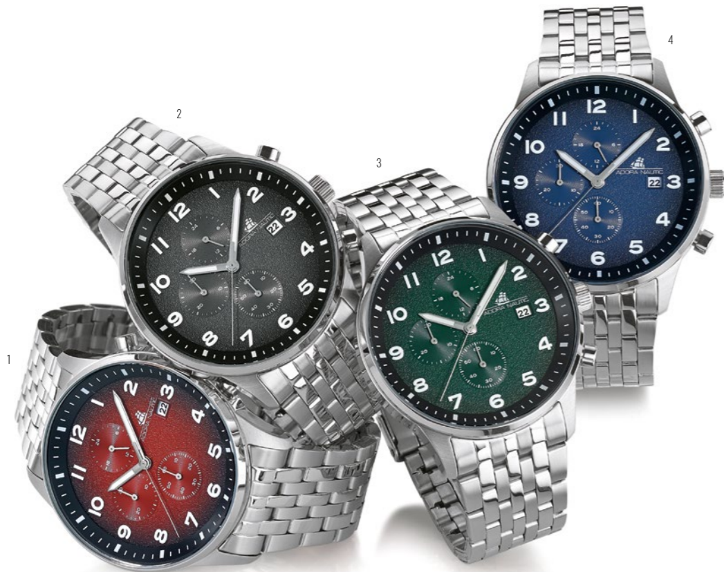
1 | AN2323 Herrenuhr, Edelstahlband/-gehäuse, Ø 43 mm, 10 bar, 129,00 € 2 | AN2321 Herrenuhr, Edelstahlband/-gehäuse, Ø 43 mm, 10 bar, 129,00 € 3 | AN2322 Herrenuhr, Edelstahlband/-gehäuse, Ø 43 mm, 10 bar, 129,00 € 4 | AN2320 Herrenuhr, Edelstahlband/-gehäuse, Ø 43 mm, 10 bar, 129,00 € 5 | AN2282 Herrenuhr, Edelstahlband/-gehäuse, Ø 42 mm, Automatik-Werk, 50 bar, 249,00 € 6 | AN2283 Herrenuhr, Edelstahlband/-gehäuse, Ø 42 mm, Automatik-Werk, 50 bar, 249,00 € 7 | AN2284 Herrenuhr, Edelstahlband/-gehäuse, Ø 42 mm, Automatik-Werk, 50 bar, 249,00 € 8 | AN2285 Herrenuhr, Edelstahlband/-gehäuse, Ø 42 mm, Automatik-Werk, 50 bar, 269,00 €