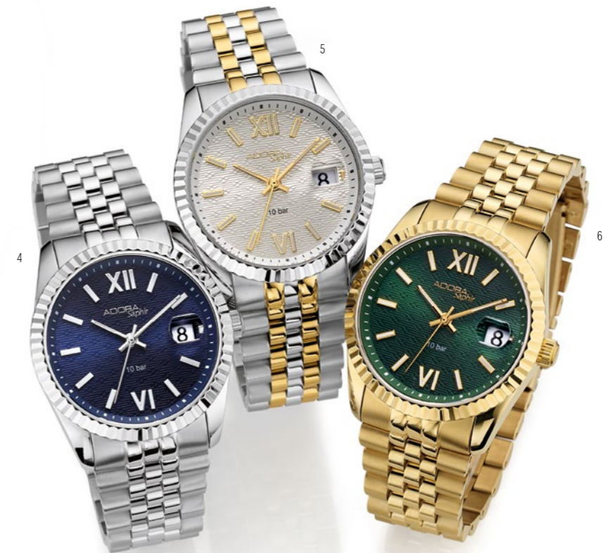
4 | AS4630 Herrenuhr, Edelstahlband/-gehäuse, Ø 39 mm, 10 bar, 129,00 € 5 | AS4631 Herrenuhr, Edelstahlband/-gehäuse, Ø 39 mm, 10 bar, 149,00 € 6 | AS4632 Herrenuhr, Edelstahlband/-gehäuse, Ø 39 mm, 10 bar, 149,00 €

Silber oder Gold – für welche Farbe entscheiden Sie sich? Wer beide Töne vereinen möchte, wählt ein Uhrenmodell mit Bicolor-Armband.